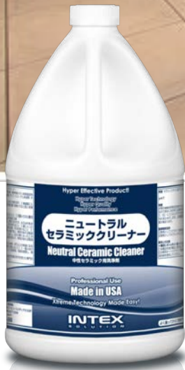
ニュートラルセラミッククリーナー ケース / 3.8L 4本入

ニュートラルセラミッククリーナーはポーラス（微細孔）に入り込んだ汚れを強力に浮かせます。環境配慮の中性です。